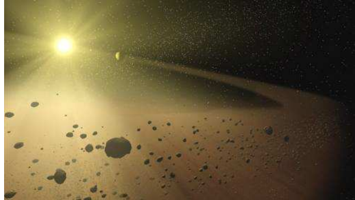
Ilustração da NASA mostra o cinturão de asteróides

Paula Rothman, de INFO Online Quinta-feira, 29 de abril de 2010 - 11h27